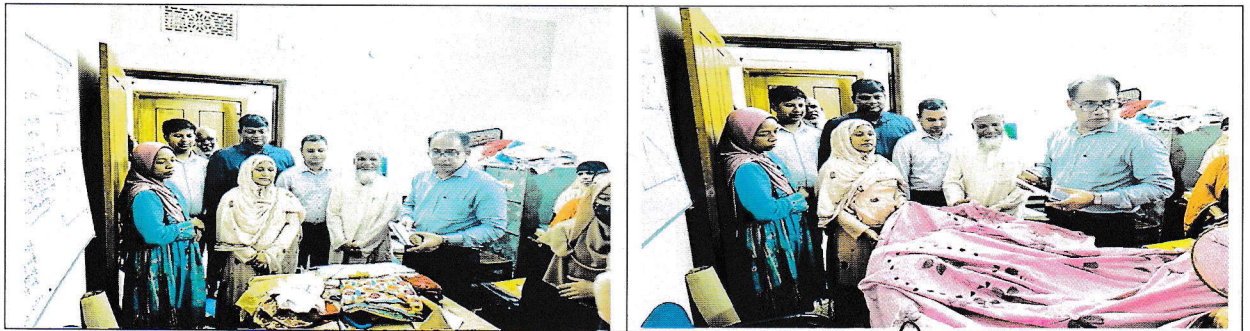
প্রশিক্ষণ কার্যক্রম পরিদর্শনের ছবি