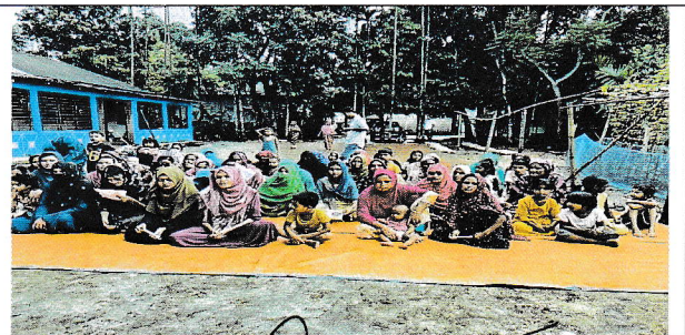
পরিদর্শনকালে বিশেষ উঠান বৈঠকের ছবি