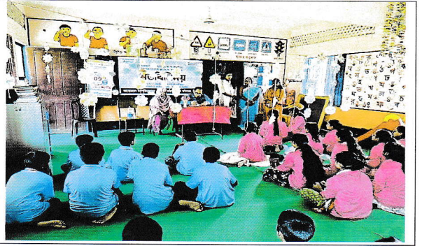
কিশোর-কিশোরী ক্লাব, কৃষ্ণ গোবিন্দ সরকারি প্রাথমিক বিদ্যালয়, খাদিমপাড়া, সিলেট পরিদর্শনের ছবি।