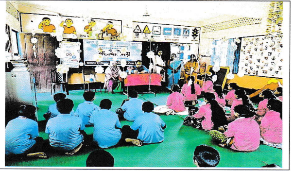
কিশোর-কিশোরী ক্লাব, বাইশটিলা সরকারি প্রাথমিক বিদ্যালয়, খাদিমনগর, সিলেট পরিদর্শনের ছবি।