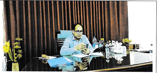
বাংলাদেশ শিশু একাডেমি, সিলেট পরিদর্শনের ছবি।