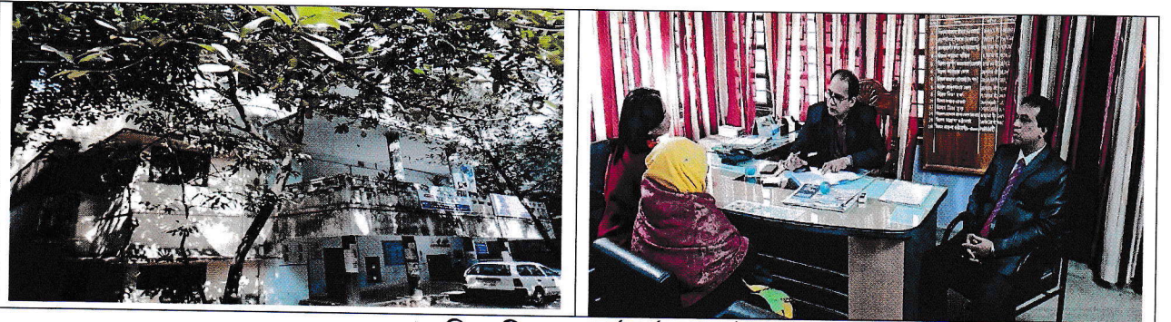
জেলা মহিলা বিষয়ক কর্মকর্তার কার্যালয়।

১.১। নাসিরাবাদ মৌজার বি.এস খতিয়ান নং-১০ এর বি.এস দাগ নং- ১৫৬৬ এর ০.২৭০৬ একর জমির উপর স্থিত পরিত্যক্ত বাড়িটি (জমিসহ) সংরক্ষিত তালিকা হতে বিক্রয় তালিকায় স্থানান্তর করে মহিলা ও শিশু বিষয়ক মন্ত্রণালয়ের অনুকূলে জেলা মহিলা বিষয়ক কর্মকর্তার কার্যালয়, চট্টগ্রাম এর নামে প্রতিকী মূল্যে বিক্রয়ের প্রয়োজনীয় ব্যবস্থা গ্রহণের জন্য জেলা প্রশাসক, চট্টগ্রাম ১৬/৯/২০১৪ তারিখে গৃহায়ন ও গণপূর্ত মন্ত্রণালয় বরাবর অনুরোধপত্র প্রেরণের জন্য মহিলা ও শিশু বিষয়ক মন্ত্রণালয়কে অনুরোধ করে। এ বিষয়ে কোন অগ্রগতি হয়েছে মর্মে জানা যায়নি।