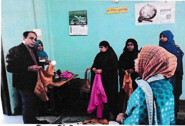
আধুনিক দর্জি বিজ্ঞান ও এমব্রয়ডারী প্রশিক্ষণ

জেলা মহিলা বিষয়ক কর্মকর্তার কার্যালয়, চট্টগ্রামে জীবিকায়নের জন্য মহিলাদের দক্ষতাভিত্তিক প্রশিক্ষণ কর্মসূচির প্রশিক্ষণ কার্যক্রম পরিদর্শন করি। প্রশিক্ষণ কর্মসূচির আওতায় ০৫টি ট্রেডে (আধুনিক দর্জি বিজ্ঞান ও এমব্রয়ডারী; মোবাইল ফোন সার্ভিসিং; ব্লক, বাটিক এন্ড প্রিন্টিং; বিউটিফিকেশন; শো-পিস তৈরী) ২০ জন করে মোট ১০০ জনকে সম্পূর্ণ বিনামূল্যে প্রশিক্ষণ প্রদান করা হচ্ছে। প্রশিক্ষণের মেয়াদ ০৩ মাস। প্রশিক্ষণার্থীদের দৈনিক ১০০/- হারে প্রশিক্ষণ ভাতা প্রদান করা হচ্ছে। প্রশিক্ষণার্থীদের উৎপাদিত পণ্য সামগ্রী বিক্রয়ের জন্য জেলা কার্যালয়ে একটি বিক্রয়কেন্দ্র রয়েছে।