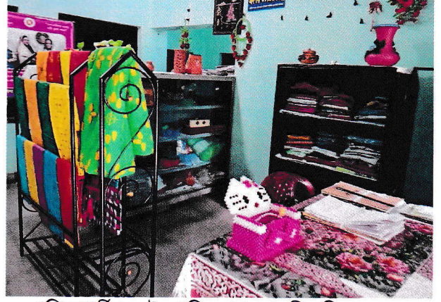
প্রশিক্ষণার্থীদের উৎপাদিত পণ্য সামগ্রীর বিক্রয়কেন্দ্র