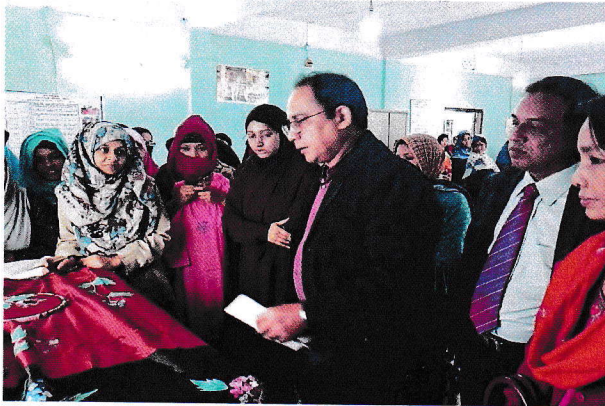
ব্লক, বাটিক এন্ড প্রিন্টিং প্রশিক্ষণ