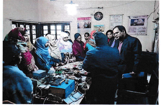
মোবাইল ফোন সার্ভিসিং প্রশিক্ষণ