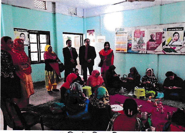
শো-পিস তৈরীর প্রশিক্ষণ