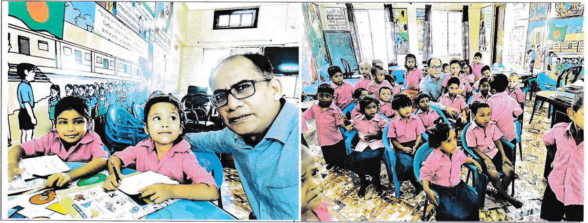
ডে-কেয়ার সেন্টার, রায়নগর, সিলেট পরিদর্শনের ছবি