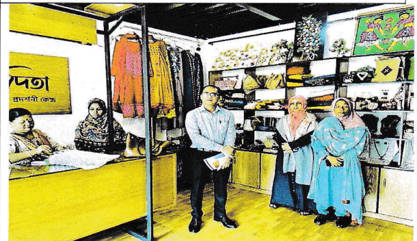
প্রশিক্ষণ কার্যক্রম এবং হস্তশিল্প বিক্রয় ও প্রদর্শনী কেন্দ্র পরিদর্শনের ছবি।