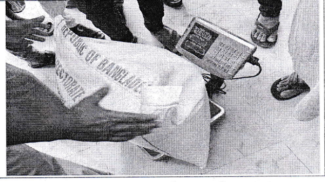
খাদিমপাড়া ইউনিয়ন পরিষদ, সিলেট সদর, ভিডলিউবি কর্মসূচির চাল বিতরণ ও চালের বস্তা পরিমাপের ছবি।